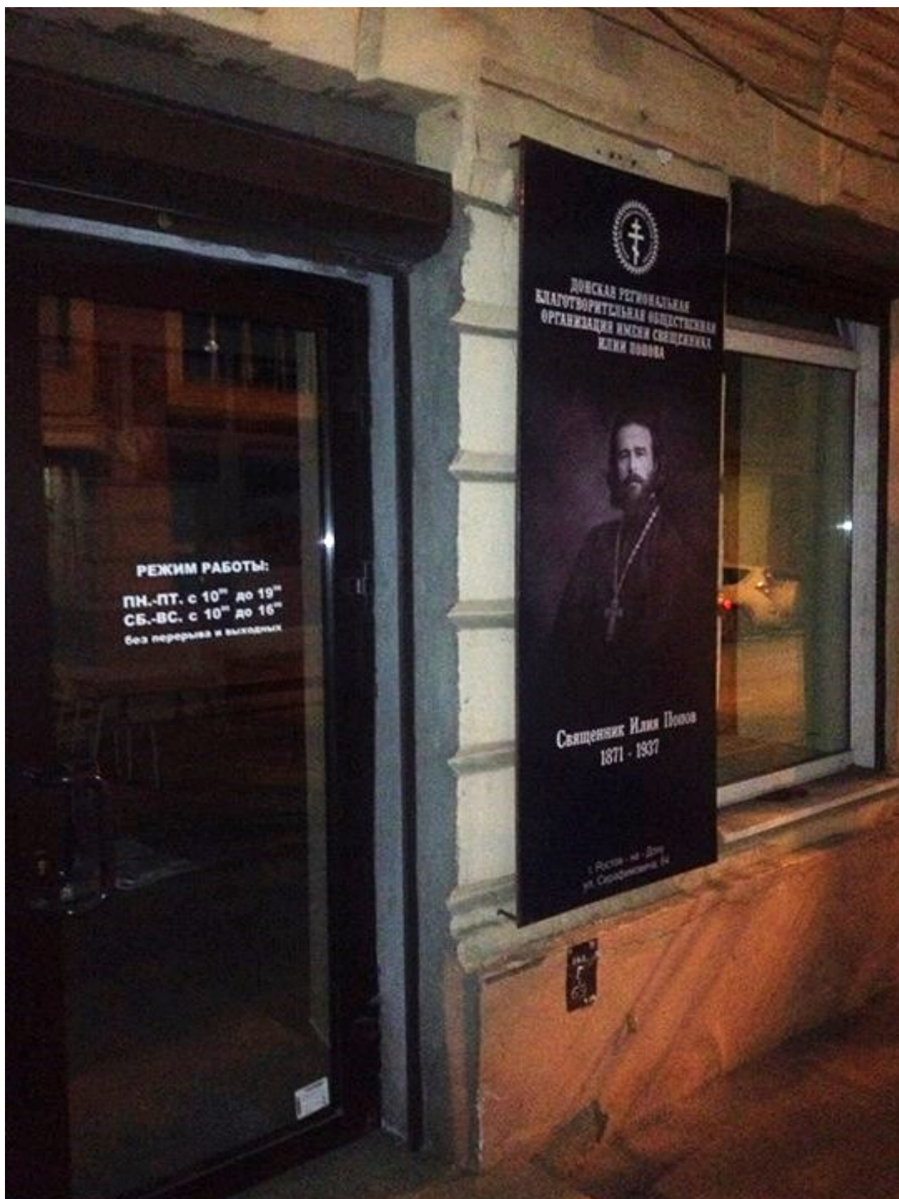
У входа в Центр