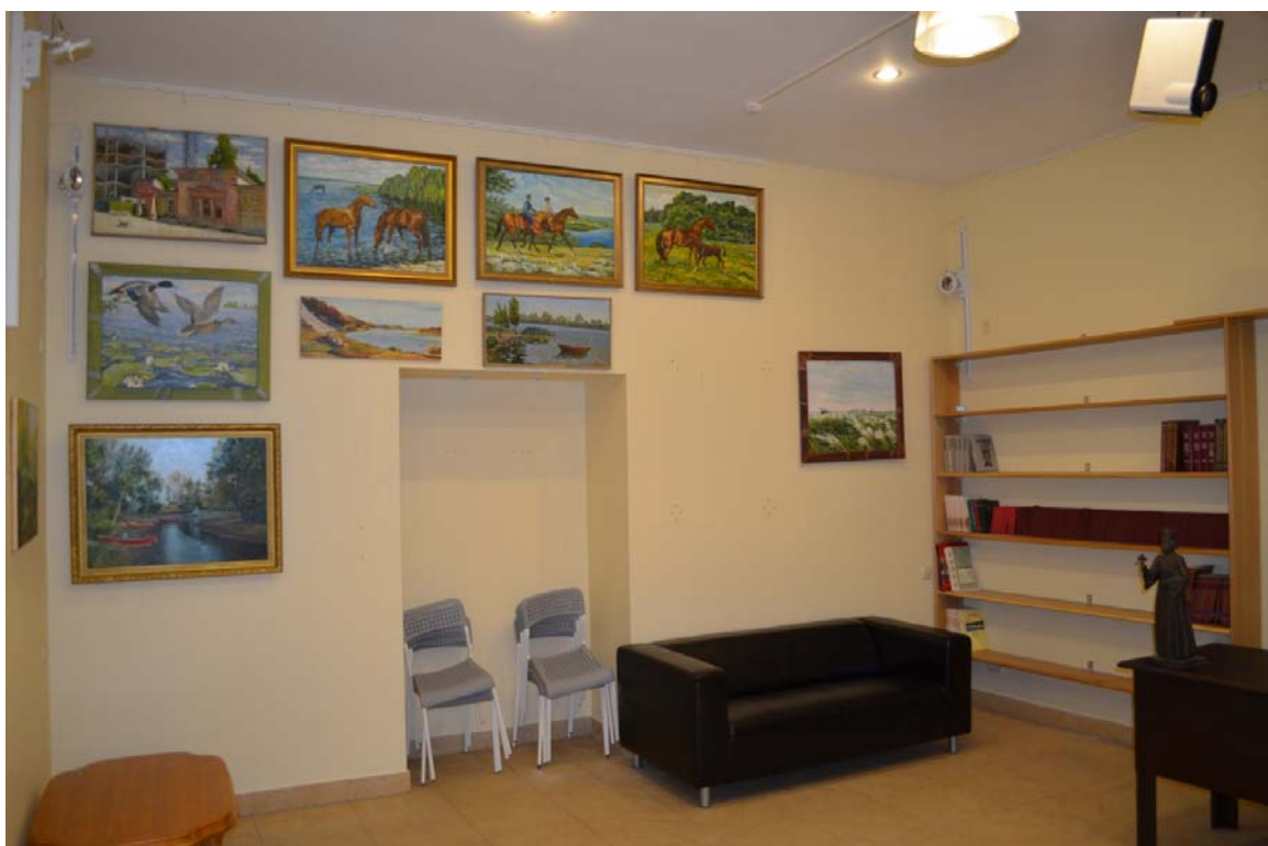
В помещении Фонда и Казачьего историко-культурного центра