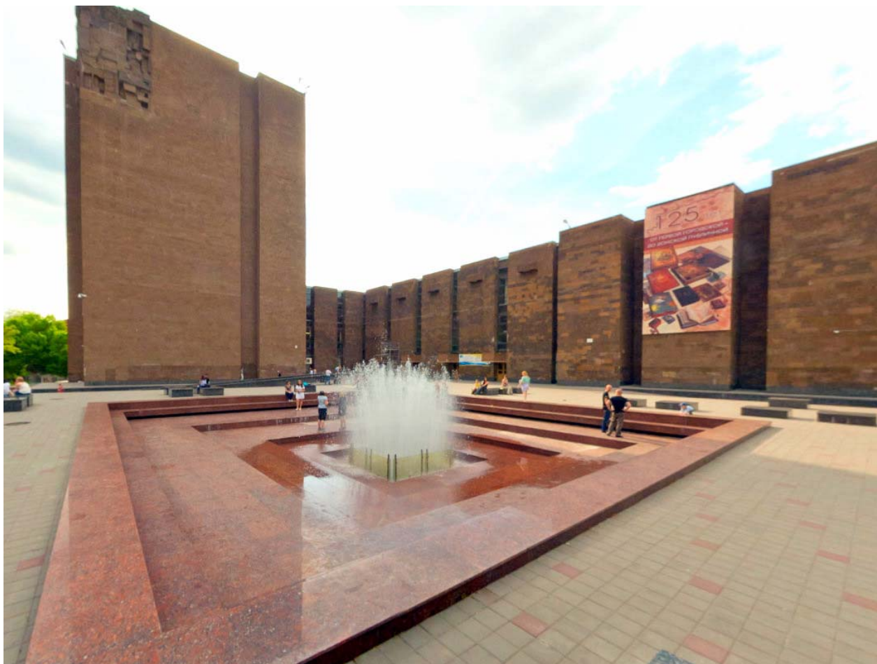
Донская государственная публичная библиотека