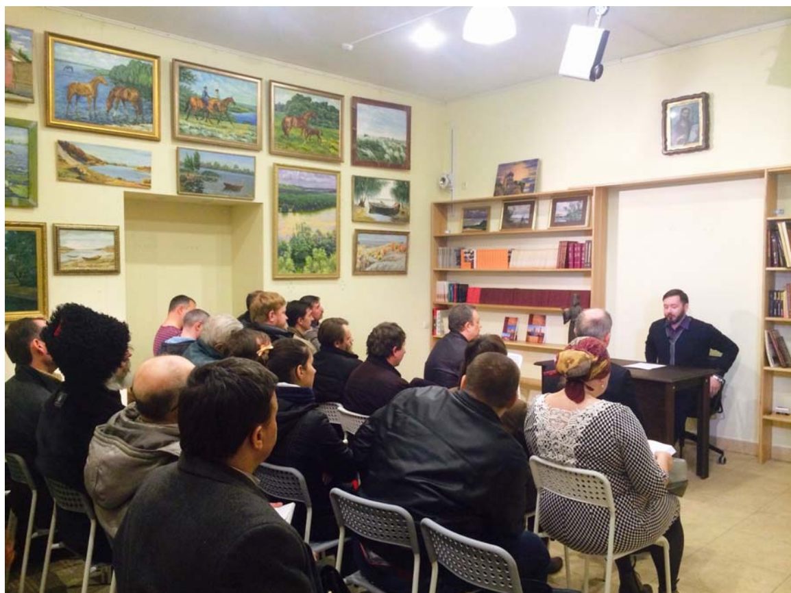
7.03.2015: первое мероприятие центра