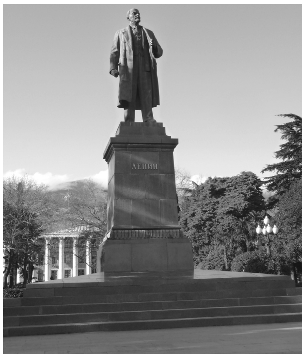
На набережной им. Ленина напротив мола, где 100 годами ранее производились массовые расстрелы и подводные захоронения. Ялта, март 2018 г.

11 декабря 2018 года исполнится 100 лет со дня рождения нашего великого соотечественника Александра Исаевича Солженицына, который раньше и яснее многих увидел, что произошло и происходит с Россией. С середины XIX и до конца XX века, то набирая ход, то замедляясь, катилось по России красное колесо, круша души и тела людские. С начала XXI века началось возрождение. Но не выбраться из-под обвала и не встать во весь рост, пока не изгоним мы красных демонов из своих душ и с улиц и площадей наших.