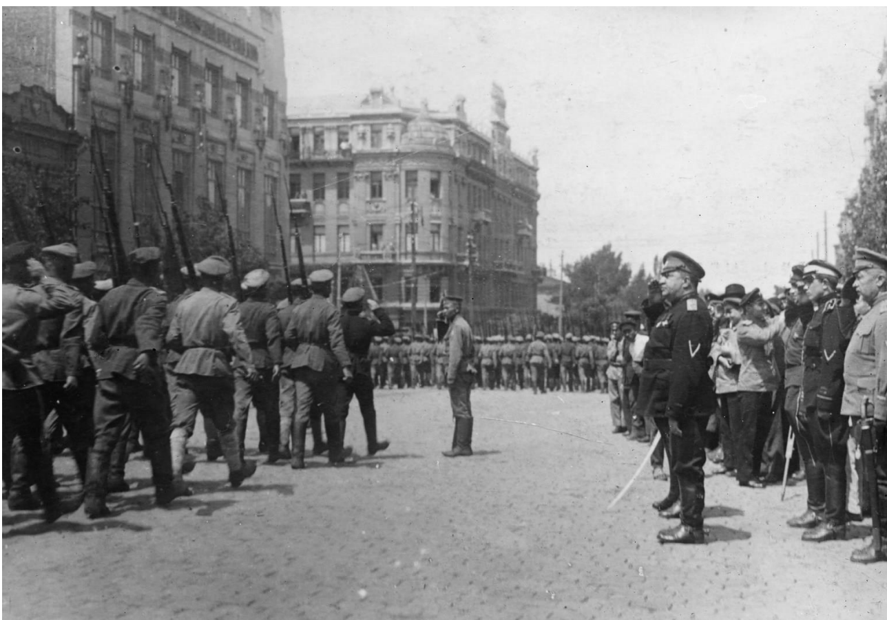
Генерал Май-Маевский на параде в Ростове-на-Дону, 1919 г.

В 2020 году на интернет-сайте нашего Фонда было опубликовано 29 материалов, посвященных столетию революции и гражданской войны. В них использованы редкие, а порою уникальные, прежде не публиковавшиеся, фотографии из фотоархива Британской миссии на Юге России, библиотеки Конгресса США, фотоархива генерала Туркула, частных казачьих фотоархивов.