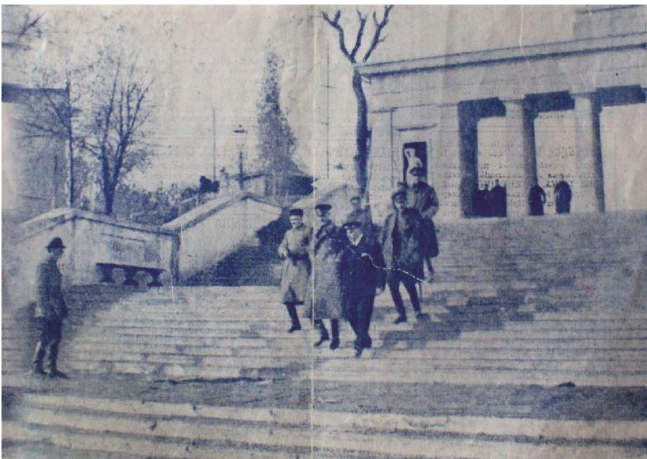
Генерал П. Н. Врангель в последний раз спускается по ступеням Графской пристани

После захода в Ялту и Феодосию в 3 часа ночи 17 ноября, получив по радио сообщение от генерала Абрамова, что эвакуация Керчи благополучно закончена, генерал Врангель приказал идти в Константинополь. Около 150 тысяч русских покинули Россию – большинство из них навсегда. А всего в период Русского исхода за границей оказалось свыше 2,5 миллионов бывших подданных Российской империи.