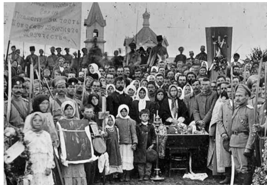
Похороны казачьего офицера. Ст. Вешенская, 1919 г.