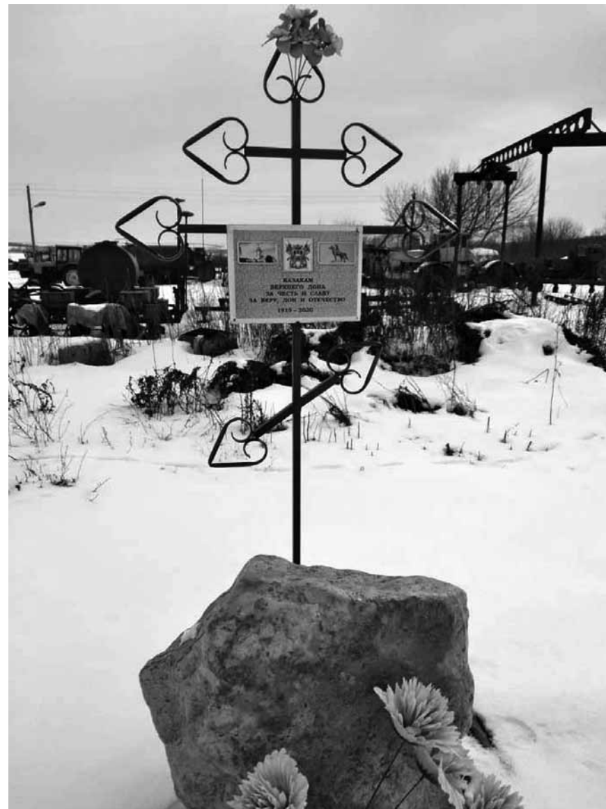
Крест, установленный на кладбище х. Песковатско-Лопатинского иногородним казакам, погибшим в первом бою