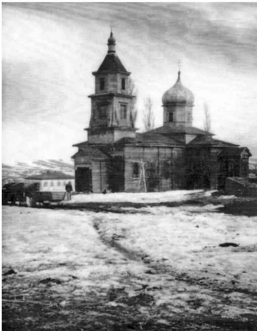
Церковь Пресвятой Богородицы и церковно-приходская школа. Хутор Песковатско-Лопатинский