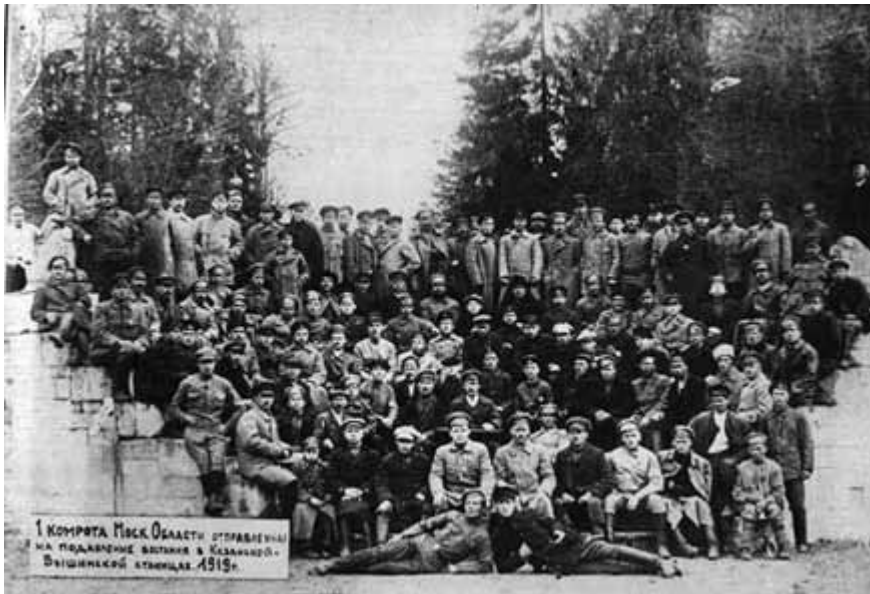
1-я комрота Московской области, отправленная на подавление восстания казаков ст. Казанской и ст. Вешенской, 1919 г.