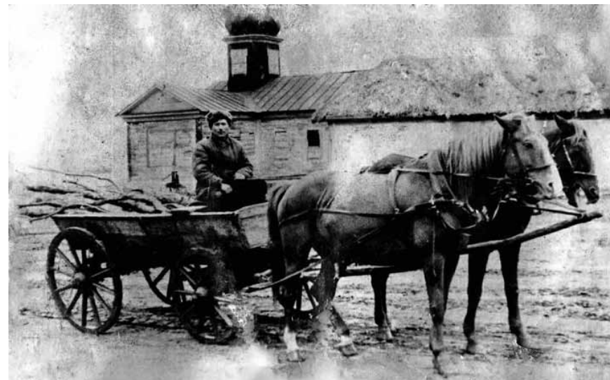
Церковь в х. Морозовском