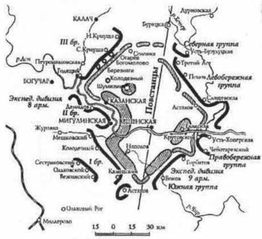
Карта Верхне-Донского восстания 1919 г.