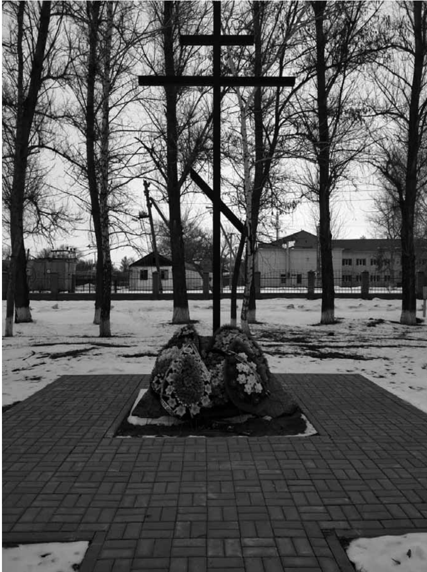
Крест, установленный в центре ст. Шумилинской в память о казаках, погибших в Верхне-Донском восстании 1919 г.