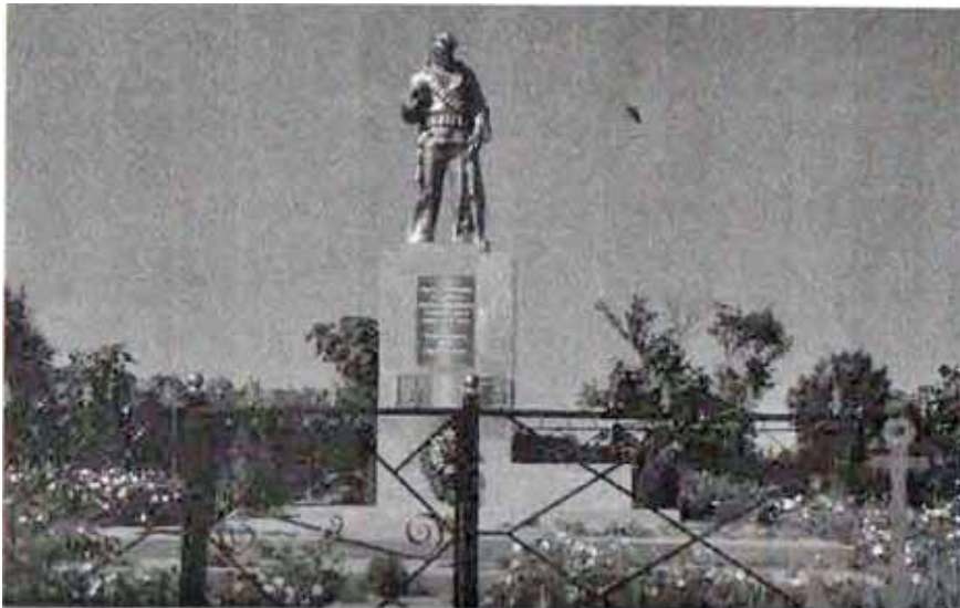
Памятник погибшим балтийским морякам в с. Краснофлотском