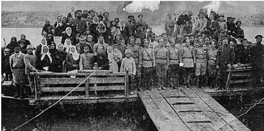
Проводы казаков. На переправе ст. Казанской, 1919 г.