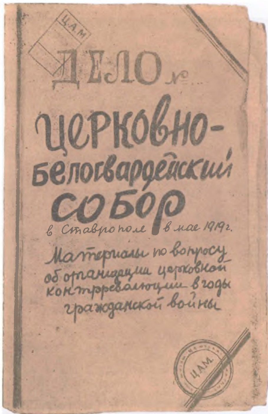
Обложка дела Собора со штампом Центрального антирелигиозного музея (из книги: Кандидова Б. П. Церковно-белогвардейский собор в Ставрополе в мае 1919 г. М., 1930)