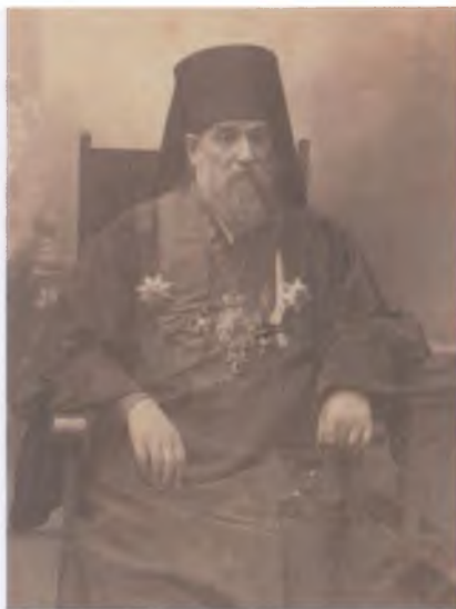
Митрофан (Симашкевич), архиепископ Донской и Новочеркасский (с 1915)