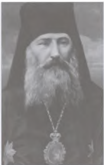
Агафодор (Преображенский), архиепископ Кавказский и Ставропольский (1916–1919)