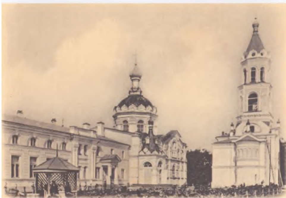
Андреевская церковь г. Ставрополя — место проведения Юго-Восточного русского церковного Собора 1919 г., нач. XX в.