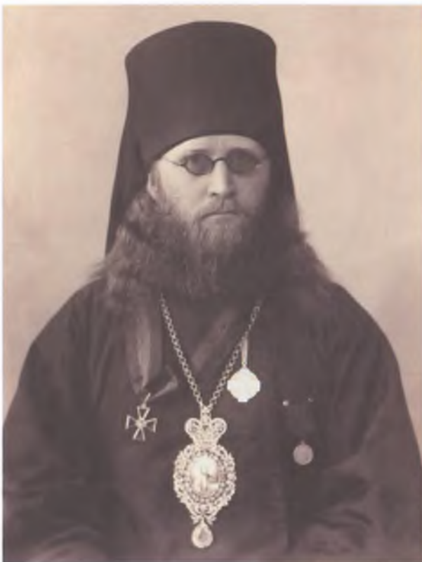
Макарий (Павлов), епископ Владикавказский и Моздокский (1917–1922)