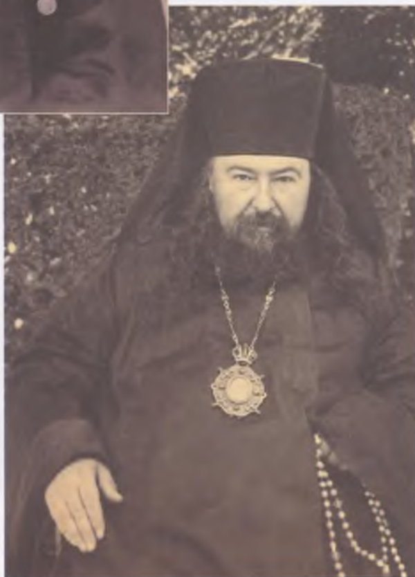
Гавриил (Чепур), епископ Челябинский и Троицкий (1918–1919)