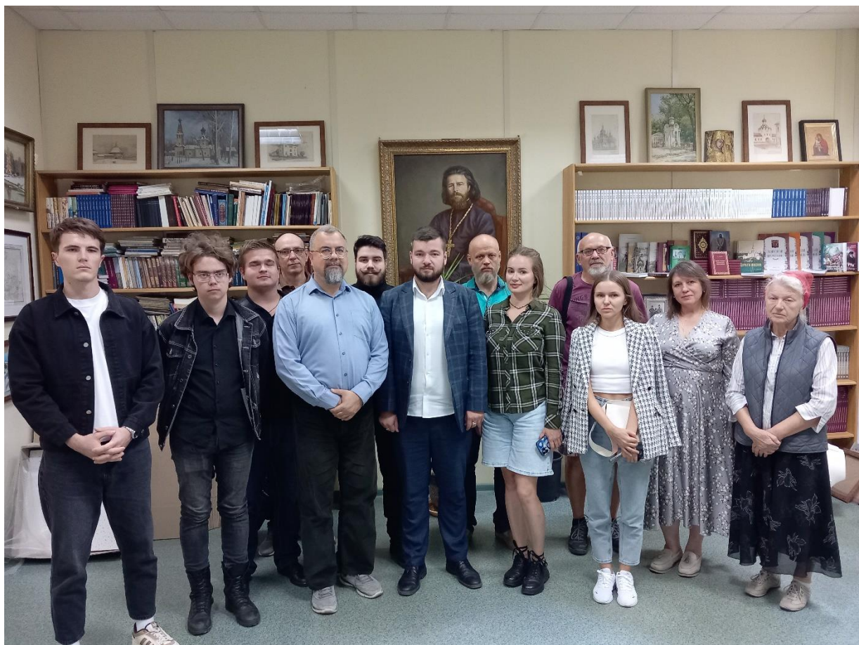
Участники интеллектуального вечера памяти Мамонтовского рейда (19 сентября 2024 г.)